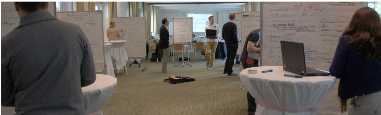
Abbildung 1: SpeedResearch Setting in der ersten Phase

Unser Anspruch ist es, Seminare und Trainings praxisorientiert, unterhaltsam und abwechslungsreich zu gestalten. Die intensive und wiederholte Auseinandersetzung mit Lerninhalten und das Lernen in einer positiven Lernatmosphäre sind für uns wesentliche Bedingungsfaktoren für nachhaltige Lern- und Transfereffekte.